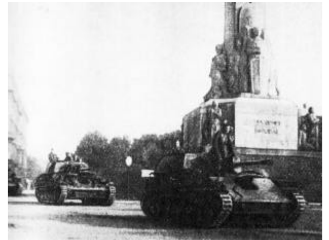
PSRS okupācijas karaspēka ienākšana Rīgā. 1940.gada 17.jūnijs.

Man kā politiski represētam, kurš cietis no 17.jūnija okupācijas režīma, ir tiesības lūgt atbildi un Jūsu, Zatlera kungs , izskaidrojumu šai glēvulībai un izdabāšanai Maskavai, kas vērsta uz to, lai tikai visi aizmirstu 1940.gada