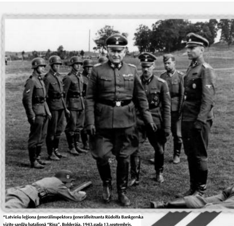
“Latviešu leģiona ģenerālinspektora ģenerālleitnanta Rūdolfa Bankerska vizīte sardžu bataljonā “Rīga”. Bolderāja, 1943.gada 13.septembris.