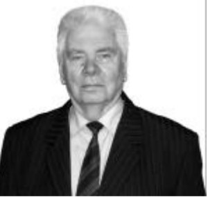
Bruno Bārs Bijušais valsts kontrolieris

26.pantam veikt parlamentāro izmeklēšanu.