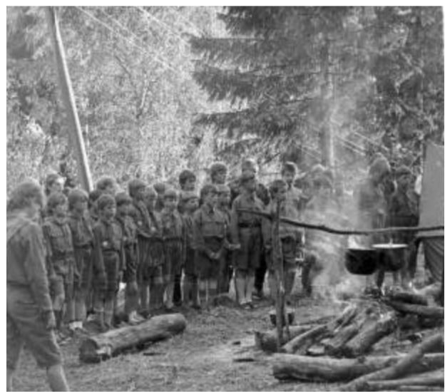
Skautu vasaras nometne

bībām mācāties vēsturi, iepazīstam savus nacionālos varoņus. Jo šodien visvairāk mums pietrūkst tieši varoņkults.