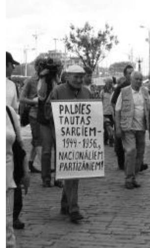
2010.gada 1.jūlija gājienā cilvēki nesa plakātus ar pateicības vārdiem nacionālajiem partizāniem.

"Cinisma kalngalu nupat nodemonstrēja Valdis Zatlers, kad Saeimā 17.jūnija uzrunā prasīja sev lielākas pilnvaras – gluži kā diktatoram. Vienlaikus viņš ne tikai nenosodīja, bet pat nepieminēja Latvijas okupācijas 70.gadskārtu!"