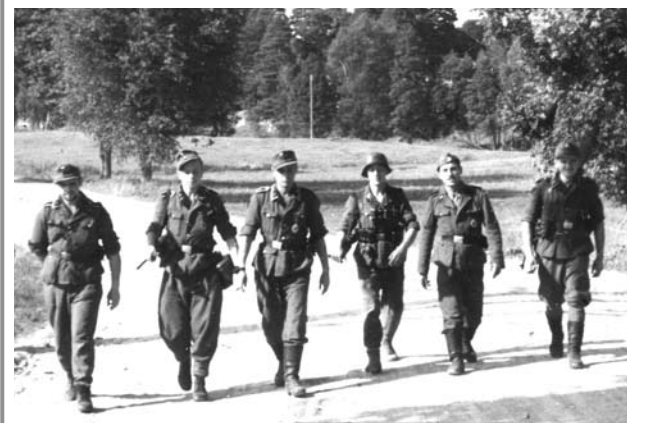
Latviešu leģionāri pie Cesvaines 1944. gada vasarā

Latviešu leģionāru piemiņas dienas pasākumi 16. MARTĀ