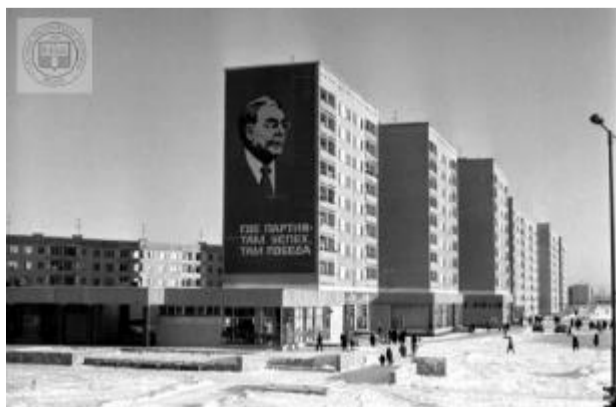
Purvciema dzīvojamo namu rajons Rīgā. 1981. gads.