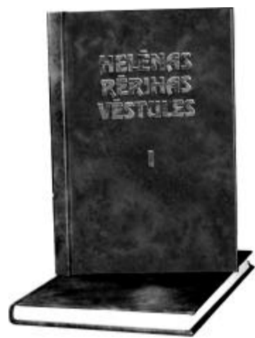
(Helēnas Rērihas vēstules, II sējums. Rīga: Vieda, 1999, 403.-407.lpp.)

Nobeigumā gribu teikt, ka sievietēm nekavējoties jāķeras pie sevis pilnveidošanas visās jomās, bet tas nav paveicams vienā mirkli. Mums, sievietēm, no daudz kā ir jāatbrīvojas, un visupirms sāksim izkopt savas pašcieņas apziņu un drosmīgi iemācīsimies balstīties uz saviem spēkiem un zināšanām, lai iesaistītos lielajā celsmē vispārības labā un uzņemtos tajā savu daļu atbildības.