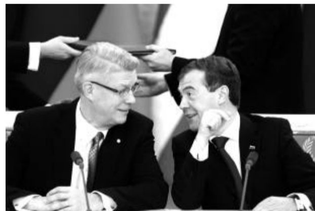
Latvijas prezidents Valdis Zatlers un Krievijas prezidents Dmitrijs Medvedevs Maskavā, 2010.gada decembrī

maksā ne santīma mūsu represētajiem par Sibīrijas vergu gadiem. Latvijas