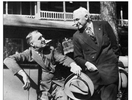
Franklins Delano Rūzvelts un Bernards Baruchs

rījuma cilvēki no ASV saņēma ne mazāk kā 100 tonnas zelta stieņu, milzīgu daudzumu sudraba, dārglietu un antīku lietu, bet Čans Kaiši – 250 papīra lapas un mierīgas vecumdienas Taivānas salā. Ap 40. gadu sākumu Baruchs jau bija miljardieris, bet viņa dividendes no politikā iejauktā biznesa virsotni sasniegta Otrā Pasaules kara gados un pēckara kodolbruņošanās sacensību laikā.