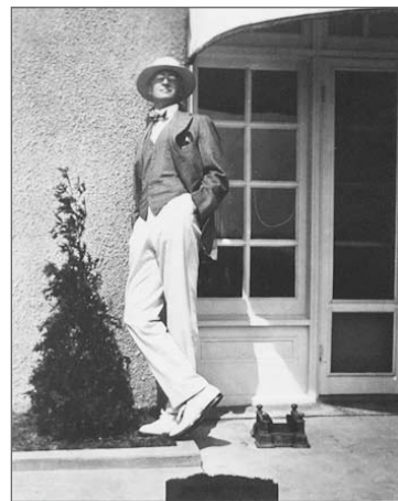
Jaunais Baruchs – brokeru kompānijas īpašnieks

Sākot ar 1912. gadu, Baruchs izspēlēja politisko kārti, finansējot Vudro Vilsona pirmsvēlēšanu kampaņu. Pateicībā par atbalstu, Vilsons viņu ievēd Nacionālās drošības padomē.