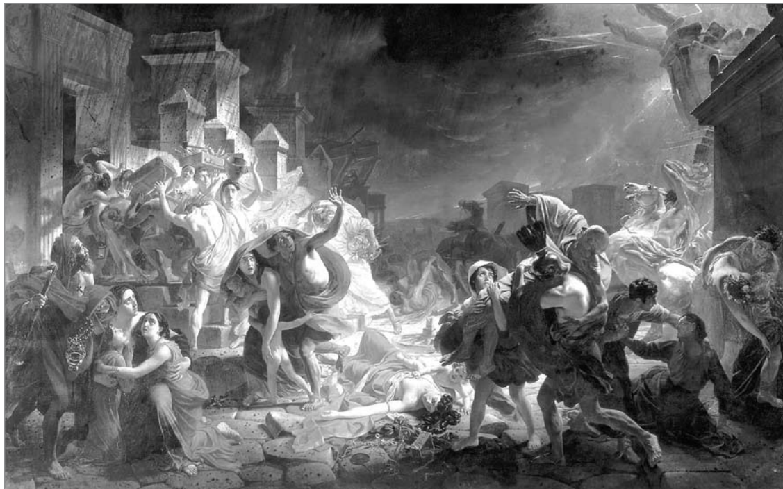
Kārlis Brilovs (Карл Павлович Брюллов) "Pompeju pēdējā diena", 1828.