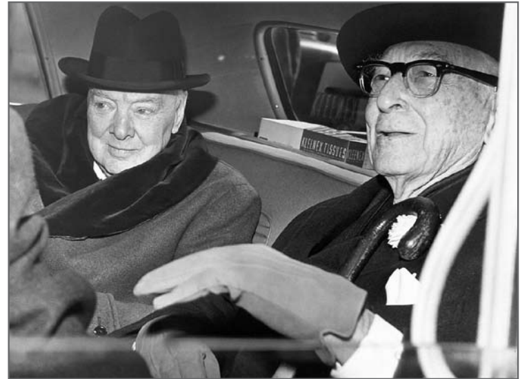
Vinstons Čērčils un Bernards Baruchs automašīnā

1929. gada 24. oktobrī, Ņujoras biržas katastrofas dienā jeb “melnajā ceturtdienā”, Baruchs atveda