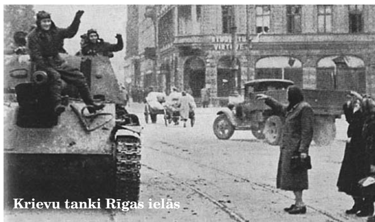
Krievu tanki Rīgas ielās

Tagad mums ir milzīga piektā (rusfašistu) kolonna, kas aug augumā ar katru dienu. Nav ne maziņo šaubu, ka viņu darbības plāni pret latviešu tautu jau sen Maskavā ir izstrādāti un apstiprināti. Mums vairs nav arī latviešu tautai uzticīgas valdības – tā kalpo savām