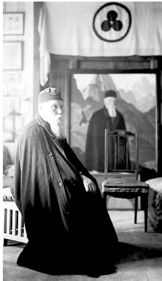
Nikolajs Rērihs pie sava portreta, ko gleznojis dēls Svjatoslavs Rērihs. Virs gleznas – Miera Karogs. Indijā, 1937. gadā

Arī citās valstīs visdažādākajās kombinācijās tiek izrunāts vārds “Kultūra”. Taču visur kā kaut kas neatliekams, kā īstēns cilvēces patvērumš. Kultūras aizstāvis induss droši vien valkā savu nacionālo tērpu; dzejnieks ķīnietis, kas domā par kultūru, droši vien neatsakās no ķīniešu tradīcijām. Kaukāza dēls domā par savu augsto virsotņu cēlo daili. Francijas