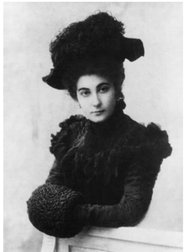
Helēna Rēriha 1900.gadā

“Pirms Pasaules lielās pārkarotāšanās visas tumšās spēku parādības tiek atklātas to labākas transmutācijas nolūkā. Pasaulē notiekošo nevar nosaukt par evolūcijas pakāpi, bet tieši var teikt, ka izpaužas pats zemiskākais, tas, ko tumsas spēki visvairāk sapriegojuši un piesātinājuši. Taču liels ir darbs, savācot kopā visu, kas spēj sekmēt diženo pārkarotāšanos. Tāpat kā Zemes sfēras blīvie slāņi gatavojas kaujai, arī Gaismas Spēki stāv sardzē. Pakāpe, ko pārdzīvo planēta, ir salīdzināma ar Kosmiskās Uguns kalvi. Visas blīvās enerģijas spriegumā uzliesmo, un sardzē stāv Ugunīgās Tiesības. Ugunīgā jaunrade savā kopā visas ugunīgās enerģijas – tā Pasauli pārkarot divu polaritāšu spriegums. Šis trakojošās enerģijas rūpīgi jāizvairās. Ir iesācies Ugunīgais laiks. Kā tagad tiek pētītas fiziskās parādības, tā tiks pētītas centru ugunīgās parādības. Agni Joga ir Diža laikmeta priekštece,